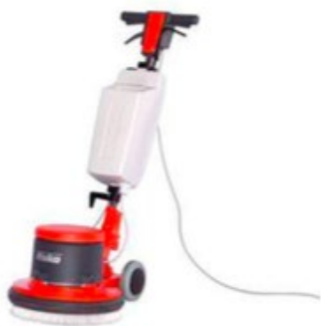
Machine de nettoyage rotative