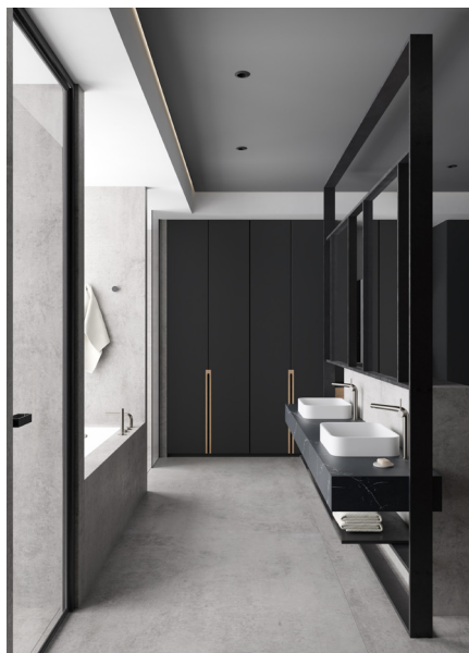
→ Dekton® Kreta.

Quaisquer diferenças na limpeza de ambos os acabamentos serão detalhadas na seção correspondente.