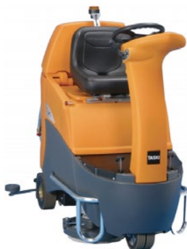
Automatyczne płuczki podłogowe